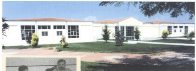
Το συνεδριακό κέντρο του ΤΕΙ Λαρίσας

3) Η προσπάθεια αναβάθμισης ολοκληρώου του προσωπικού είναι στη φάση αυτή το κύριο μέλημα της Ομοσπονδίας. Διηλεκτό κάθε μέλος του ΕΠΠ-ΤΕ να ολοκληρώσει τις προσπάθειες του για απόκτηση των προσόντων που ορίζει ο Ν. 2817/2000 αρθ.11 και 8 παρ. 16