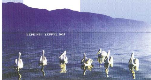
ΚΕΡΚΙΝΗ - ΣΕΡΡΕΣ 2003

Αυτή είναι η πραγματικότητα που μας ανήκει