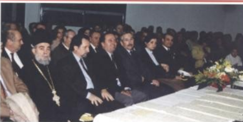
Η Διοίκηση του ΤΕΙ Λαρίσης και οι Σύ-

Το ΔΣ του Συλλόγου ΕΤΠ-ΤΕ του ΤΕΙ Αθηνών